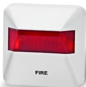
ریموت اندیکاتور متعارف RX-99